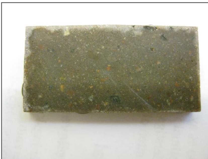
Fig.1. En av två passbitar från tillverkningen av slipen.

Mineralfördelningen framgår av tabellen ovan.